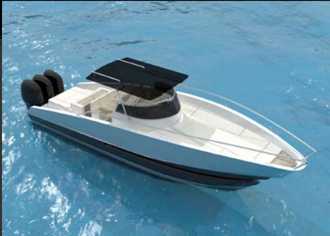
||||| AMBITIOUS CHOICE